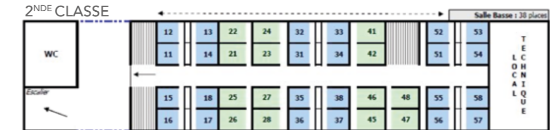
DIAGRAMME 2 NDE CLASSE / VOITURE 08/ TGV DUPLEX 2N2 CODE DIAGRAMME : DNE - MARQUAGE LITTÉRAL : TGVD AU