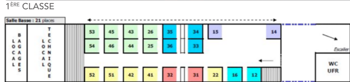
DIAGRAMME 1 ÈRE CLASSE / VOITURE 02 ET 03 / TGV DUPLEX 2N2 CODE DIAGRAMME : DNB - MARQUAGE LITTÉRAL : TGVD AU