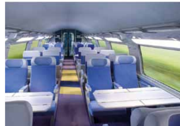
2 nde classe