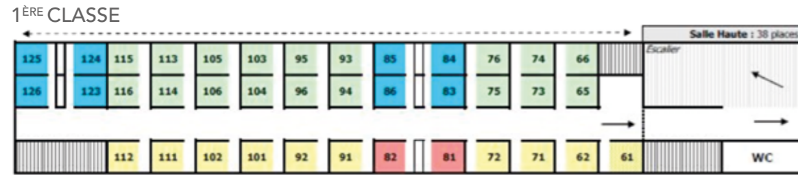
DIAGRAMME 1 ÈRE CLASSE / VOITURE 01 / TGV DUPLEX 2N2 CODE DIAGRAMME : DNA - MARQUAGE LITTÉRAL : TGVD AU