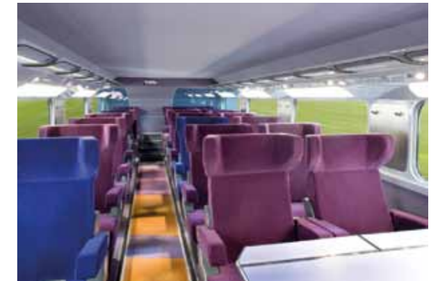
1 ère classe